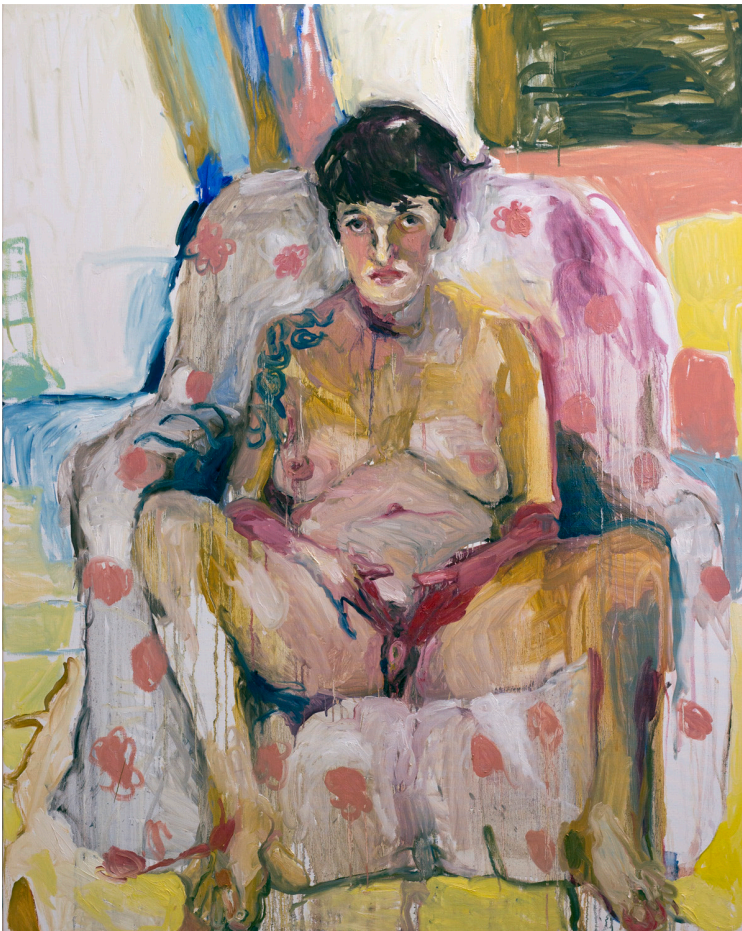
Obra: Un desnudo Técnica: Óleo sobre lienzo Medidas: 162 x 130 cm.

Señores, con nuestros cuerpos imperfectos os estamos mirando de frente, con nuestros pliegues, nuestros pezones, nuestros clítoris, con nuestra voluntad, nuestras opiniones, nuestros deseos, nuestras esperanzas y nuestras ricas diferencias.